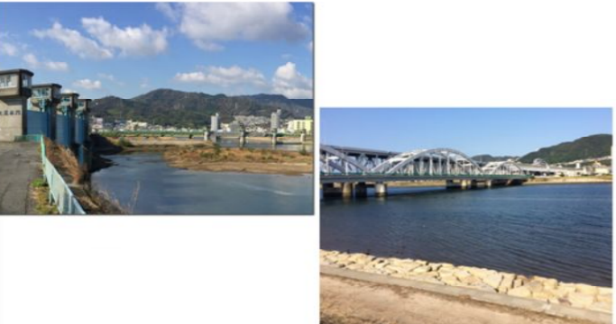
広島市西区大宮 付近(左岸) ~ 広島市西区観音 付近(左岸)

太田川放水路は広い河川敷を市民の憩いの場として、スポーツや散策に、最近整備された緊急河川敷道路は自転車も走れます。マナーを守って仲良く利用しましょう。