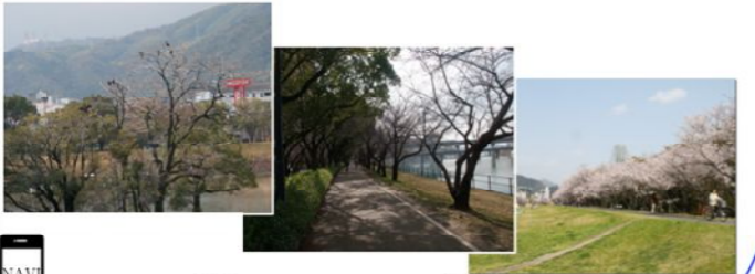
広島市東区牛田 付近~広島市中区南吉島1丁目 付近

京橋川分流点の中州は野鳥ファン必見。ここは、昔から「一本木鼻」と呼ばれ、洪水のたびに大水が直撃していたといいます。今では、サギなどの野鳥のコロニーとなり、季節によっては渡り鳥もあられ、賑やかです。岸から望遠カメラを構える人もよく見かけます。「友愛の桜みち」を通り抜けると河岸緑地の芝生が続きます。相生橋から平和公園を横に見て、住吉橋たもとの住吉橋記念燈から高速3号線過ぎまでの約1時間のコースです。